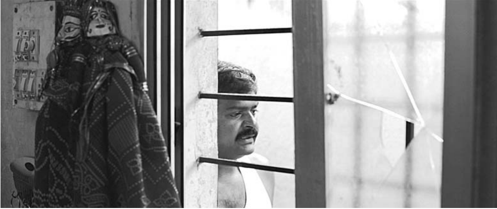
Visual / दृश्य 1

vi) What happens next? / आगे क्या होता है?