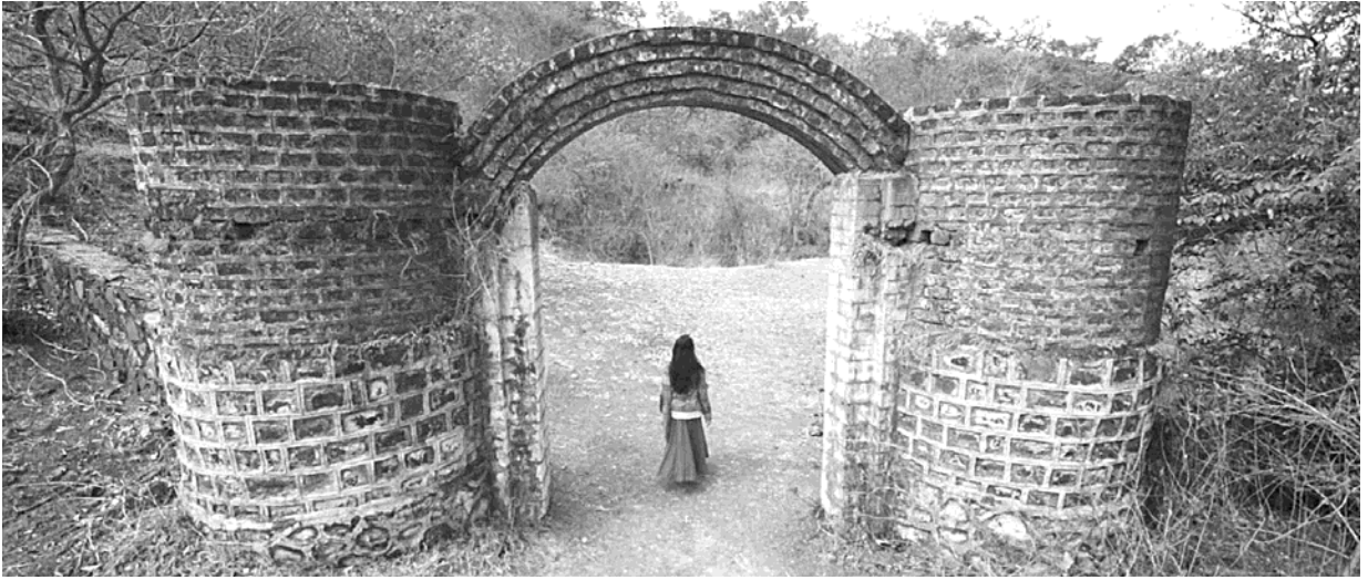
Visual / दृश्य – III