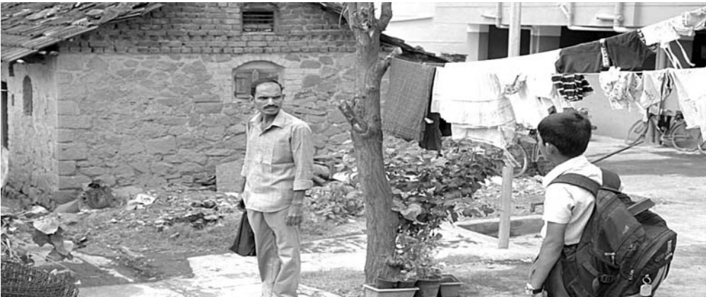
Visual / दृश्य 3