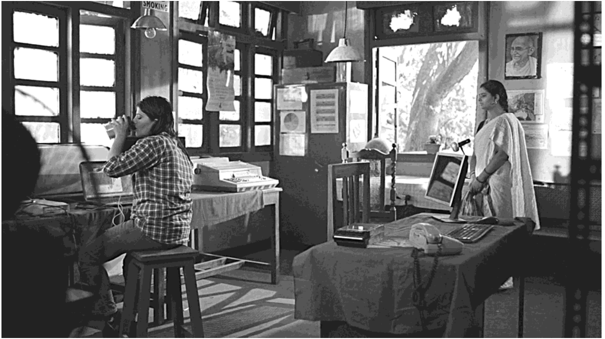
Visual / दृश्य – II