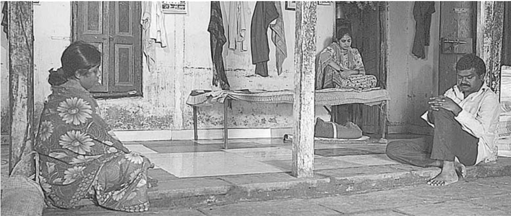
Visual / दृश्य 2