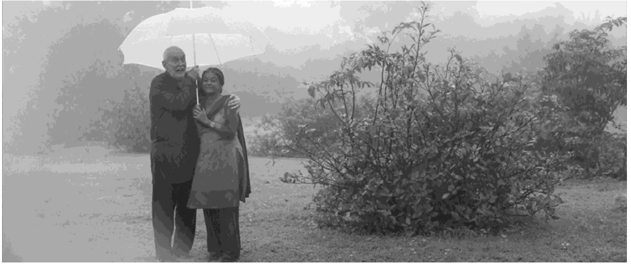
Visual / दृश्य – I

निम्नलिखित अचल छवियों ( किन्हीं दो ) की इनके दृश्य अंशों के संबंध में संयोजन, भावदशा, परिवेशीय स्थितियों और कहानी तत्व आदि का वर्णन करने के लिए संक्षेप में व्याख्या करें। (Marks/अंक 10)